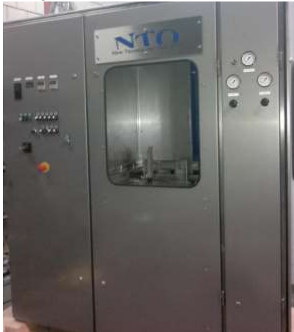
Example picture of NTO-2424 machine

NTO-2424LFS ist eine elektrisch gesteuerte Version.